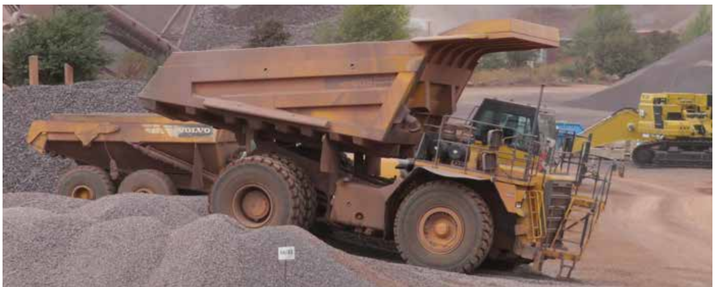
Schwere Technik im Einsatz